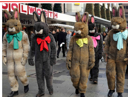
Ungewöhnliches Bild zum Nikolaus: Osterhasenaktion in der Frankfurter Innenstadt